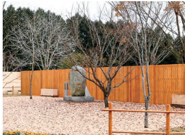
木塀・ウッドチップ