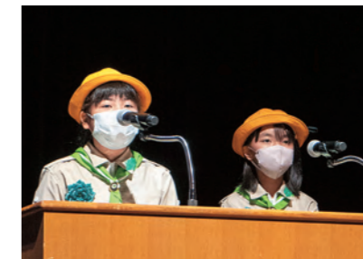
城山小学校みどりの少年団（岐阜県）