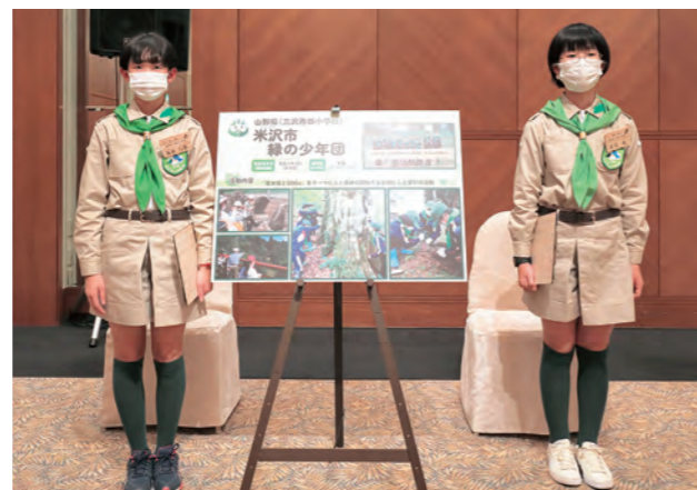
米沢市緑の少年団（山形県）