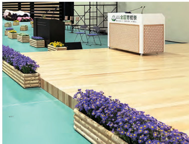
ステージフローリング