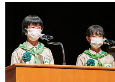
米沢市緑の少年団（山形県）