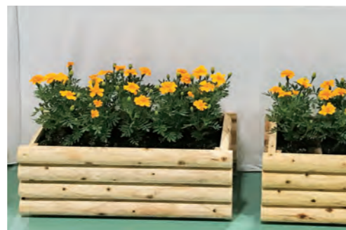
プランターカバー