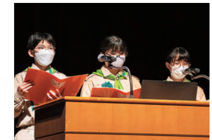
横田中学校緑の少年団（島根県）