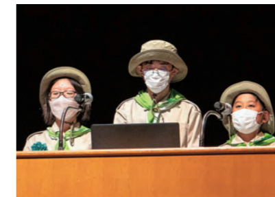
三郷小学校みどりの少年団（大分県）