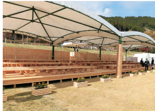
会場席（お手入れ行事）