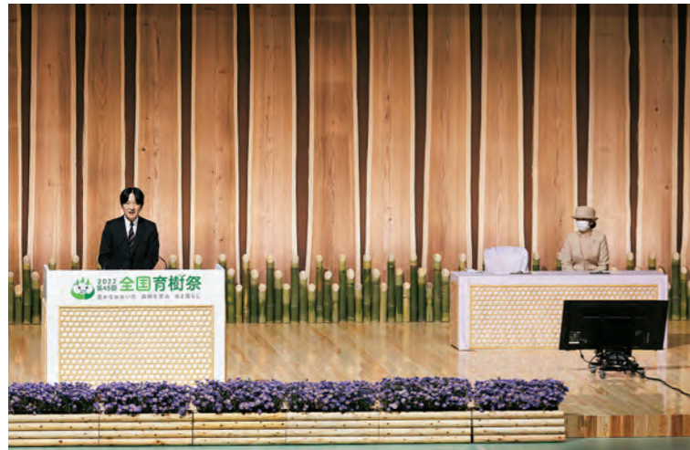
ステージバックパネル