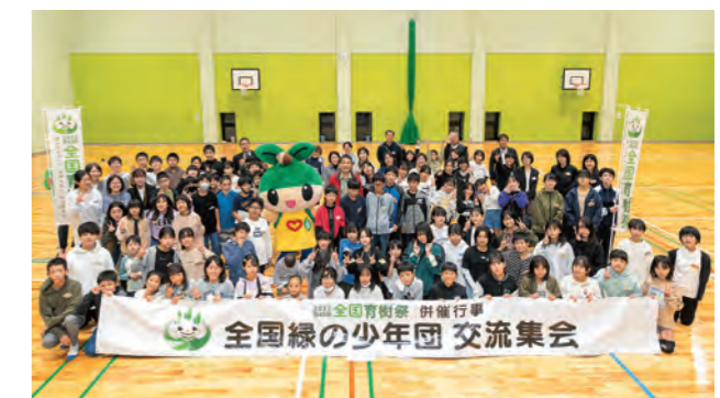
大分市立のつはる少年自然の家