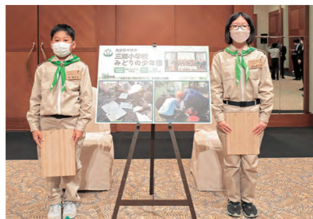
三郷小学校みどりの少年団（大分県）