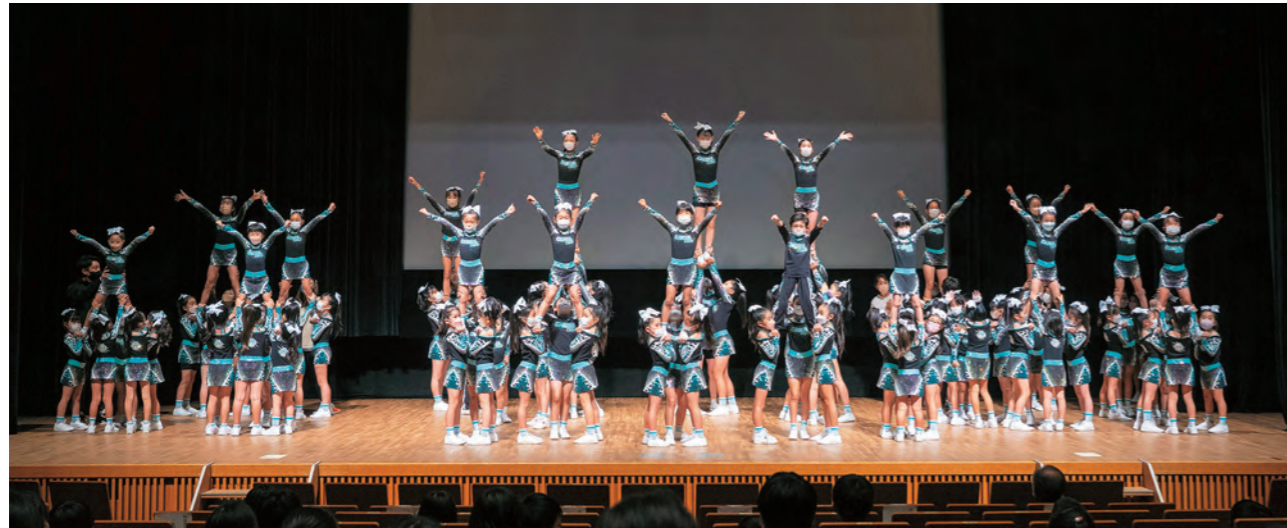
ONE ACADEMY によるチアリーディング