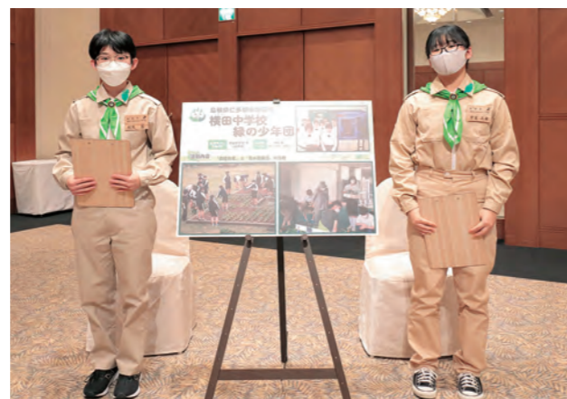
横田中学校緑の少年団（島根県）