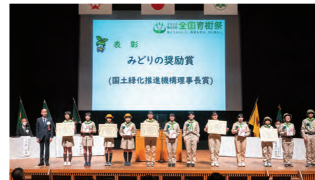
みどりの奨励賞表彰