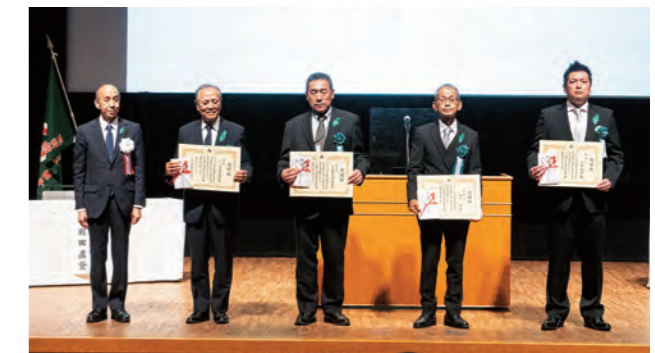
緑の少年団育成功労賞表彰