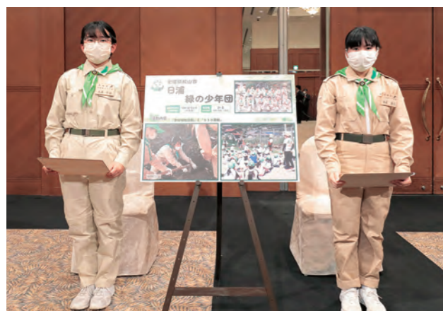
日浦緑の少年団（愛媛県）