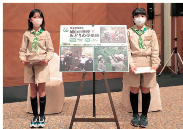
城山小学校みどりの少年団（岐阜県）