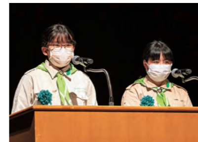
日浦緑の少年団（愛媛県）