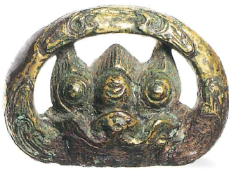
獅噛環頭 杵築市 シラハゲ古墳 (個人蔵)