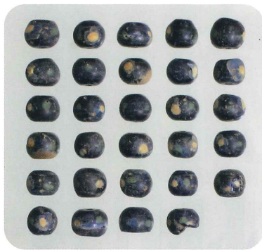
斑点文トンボ玉 豊後高田市 志手金比羅山古墳 (大分県立埋蔵文化財センター蔵)