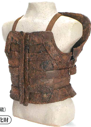
短甲 豊後高田市 峠古墳 (大分県立歴史博物館蔵) 大分県指定有形文化財