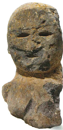
子負いの女性石人 八女市 童男山古墳群 (八女市教育委員会蔵 牛嶋茂氏撮影) 八女市指定有形文化財