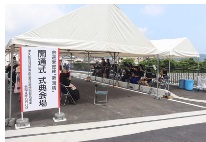
▲津久見高校吹奏楽部による演奏