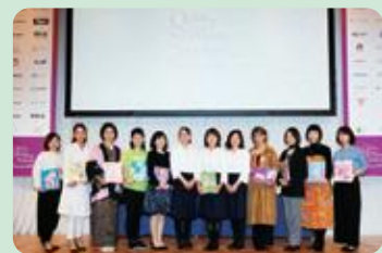
女性のスタートアップアワード