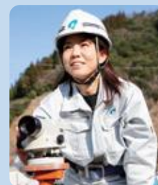
建設産業で働く女性