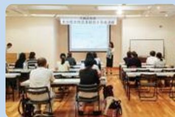
女性農業経営士養成講座