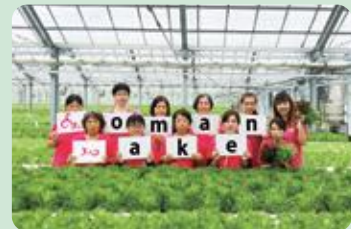
農業で活躍している女性たち