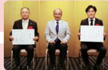
働き方改革推進優良企業表彰