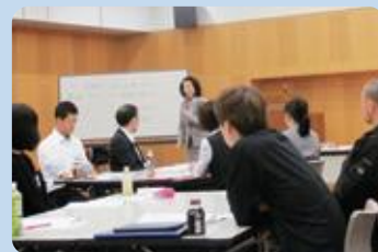
女性部下育成支援セミナー