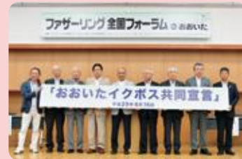
おおいたイクボス共同宣言