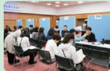
自営型テレワーカーと企業との商談会