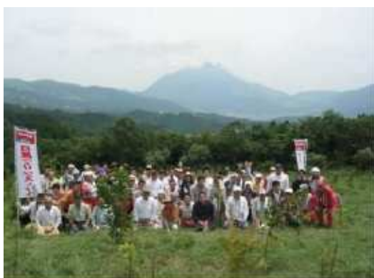
平成17年度緑の募金植樹地の下刈りを行う日産プリンス大分販売（株）の社員