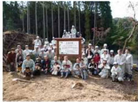
西日本高速道路株式会社九州支社 中津工事事務所