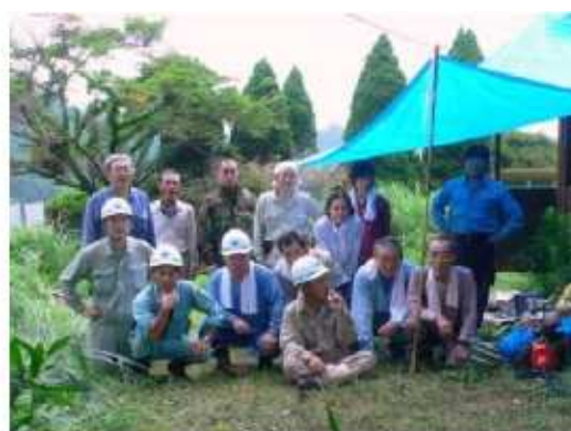
平成17年度豊かな国の森づくり大会植樹地の下刈りを行うグリーンインストラクターおおいたとボランティアの方々