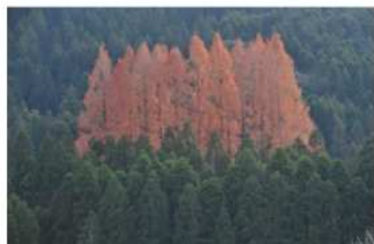
第3回「ふるさとおおいたの森」写真コンクール最優秀賞作品