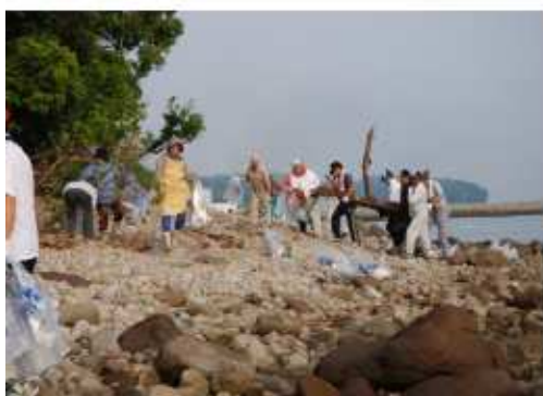
NPO法人923みんなんクラブによる実施