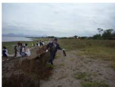
長洲アーバンデザイン会議による実施状