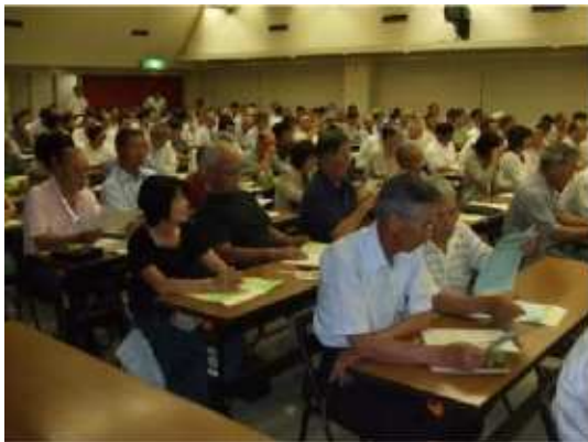
発表者の話に聞き入る参加者