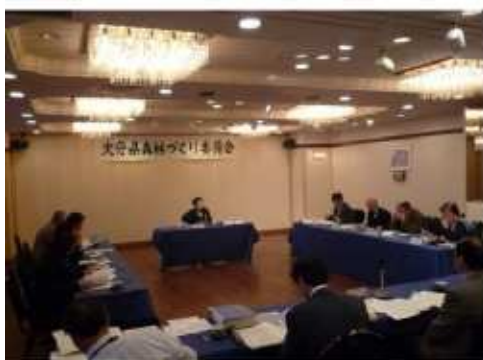
森林づくり委員会