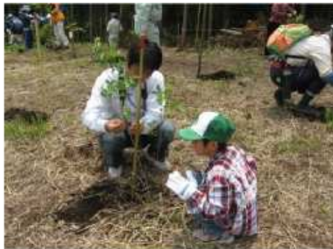
森林づくりの様子