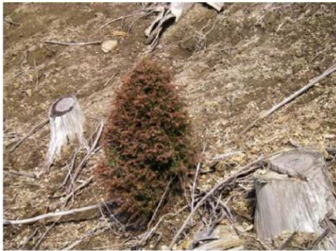
シカの食害を受け盆栽状になったスギ

シカによる森林生態系被害が県内各地で発生しており、森林の有する公益的機能の低下が危惧されている。このため、防護資材を設置し、直接的な林木への被害を防止する。また、シカの捕獲報償金事業により捕獲の強化を行いシカの生息頭数を適正な頭数まで減少させ、森林の有する公益的機能の維持増進を図る。