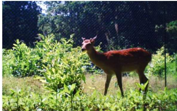
クヌギ萌芽を食害するシカ