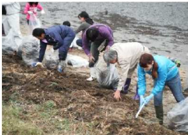
杵築市まちピカ運動推進委員会 活動写真