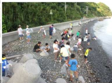
NPO法人きらり・つくみ 活動写真