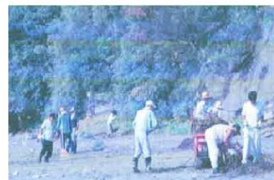
梶ヶ浜区 活動写真