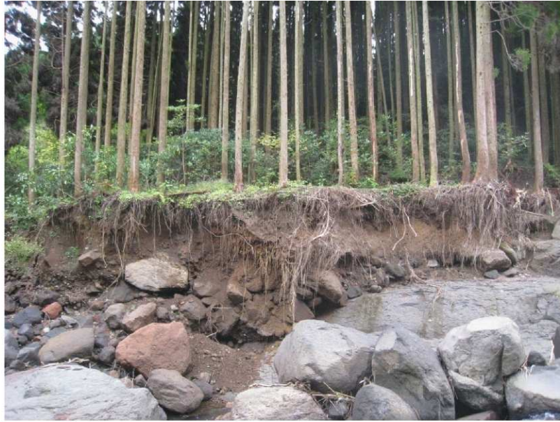
流木発生危険性の高い森林が対象