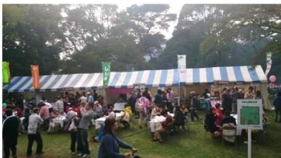
農林祭のブースでジビエ料理をPR