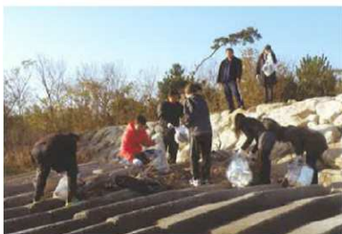
NPO法人水辺に遊ぶ会 活動写真