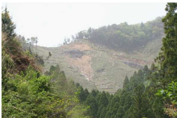
集落背後地等の危険箇所が対象