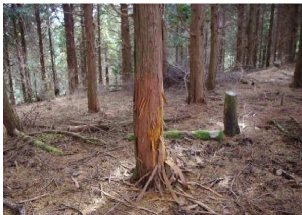
シカの角研ぎによる被害