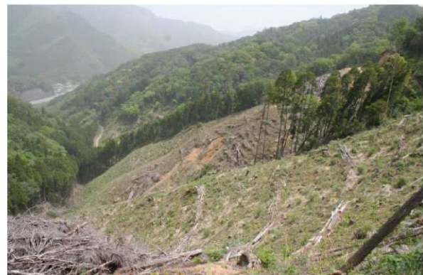
再造林を行った森林の様子