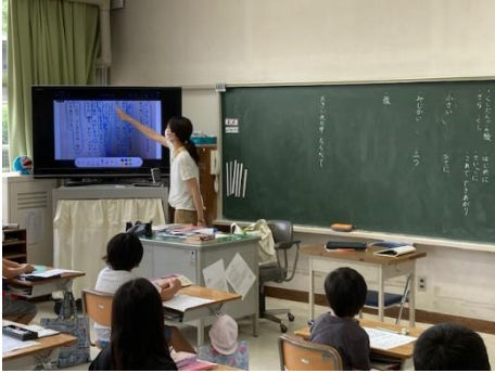
国語科⇒資料に書き込み