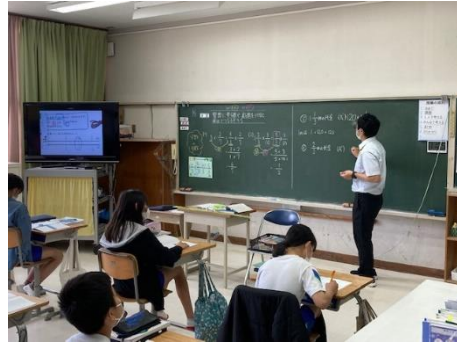
算数科⇒数直線を拡大