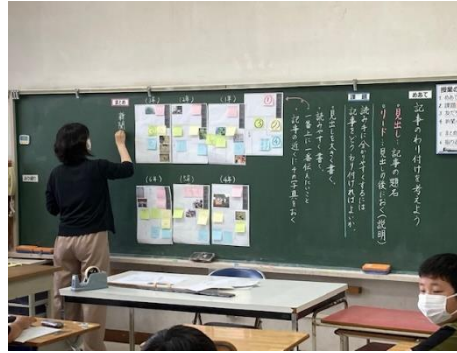
国語科⇒児童の作品の位置づけ、児童の意欲的な授業参加