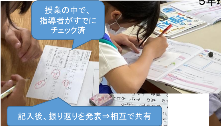
2年国語科 『振り返りシート』