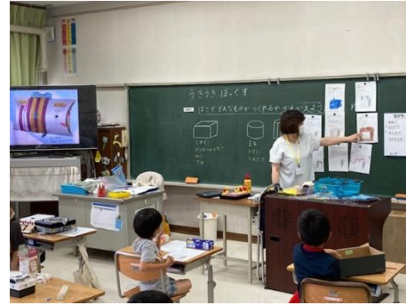
図画工作科⇒教科書作品投影