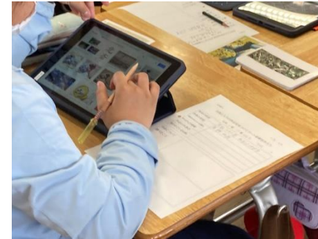
図画工作科⇒作品検索