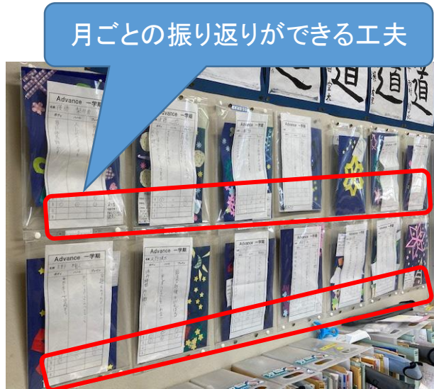
月ごとの振り返りができる工夫