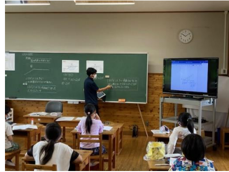
算数科⇒ワークシート提示