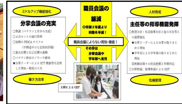
効果的な学校運営の展開