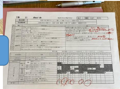
英語科⇒学習カード