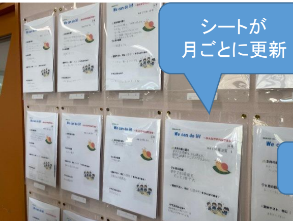
シートが 月ごとに更新