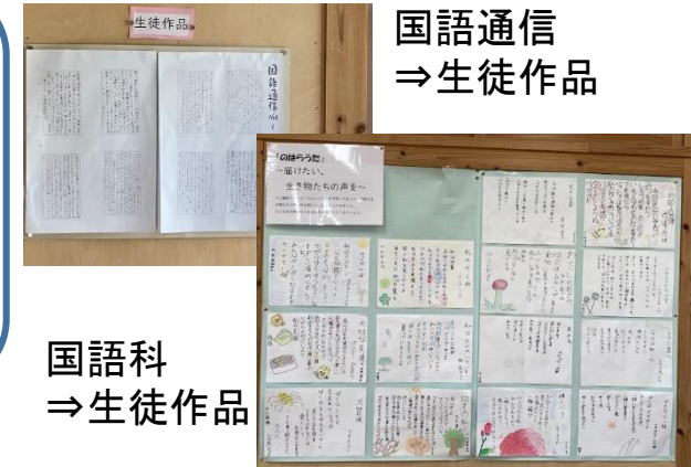
国語通信 ⇒生徒作品