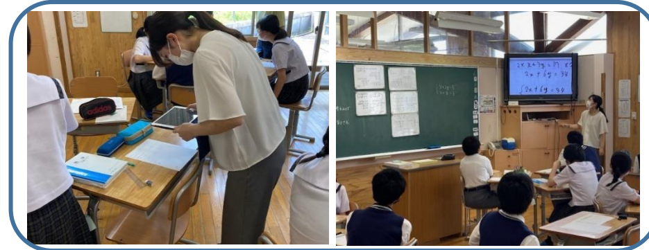
数学科⇒ワークシート撮影、拡大して投影