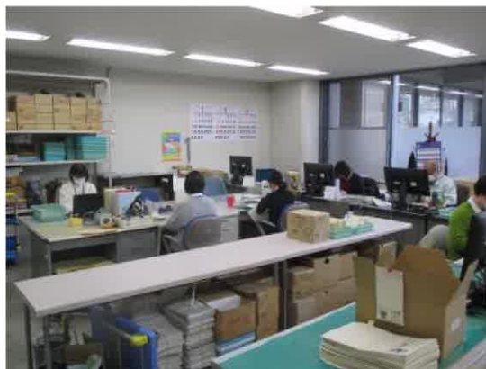
【大分県庁ワークセンター】