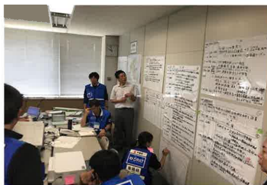
【大分県 DPAT の訓練】