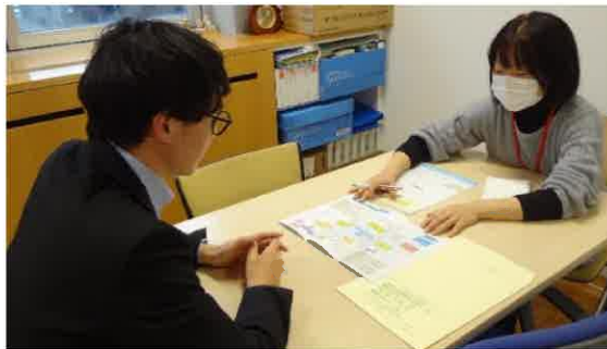
【障害者就業・生活支援センターでの相談支援】