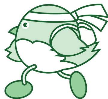
ウォーキングしながら