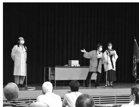
寸劇による講座の様子

事例を分かりやすく伝えるため、講義形式だけでなく、寸劇による講座も実施しています。消費生活相談員が、消費者や悪質業者に扮して、消費者が狙われやすい事例を楽しく紹介します。