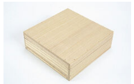
蓋をした収納状態