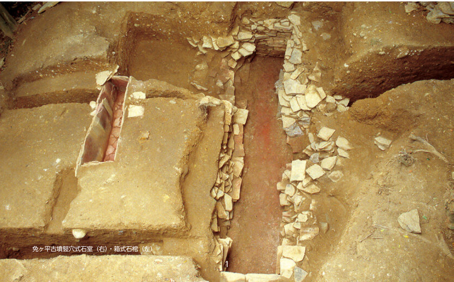
免ヶ平古墳竪穴式石室（右）・箱式石棺（左）

宇佐風土記の丘は、国指定史跡「川部・高森古墳群」を含む約19万㎡を史跡公園として整備したもので、3世紀後半の赤塚古墳から6世紀中頃の鶴見古墳まで、6基の前方後円墳や、これらの古墳の周囲に100基をこえる墳墓が存在します。これらの古墳群は古墳時代を通じ、宇佐の地を支配した首長系譜にある前方後円墳と、それぞれの首長に繋がる一族の墳墓群であると考えられています。中でも、鶴見古墳を除く前方後円墳は駅館川東岸の高台や縁辺に造営されており、宇佐平野を見下ろす位置であるとともに、宇佐平野に住む人々からしてみれば、首長墓として仰ぎ見る絶好の立地環境にあります。