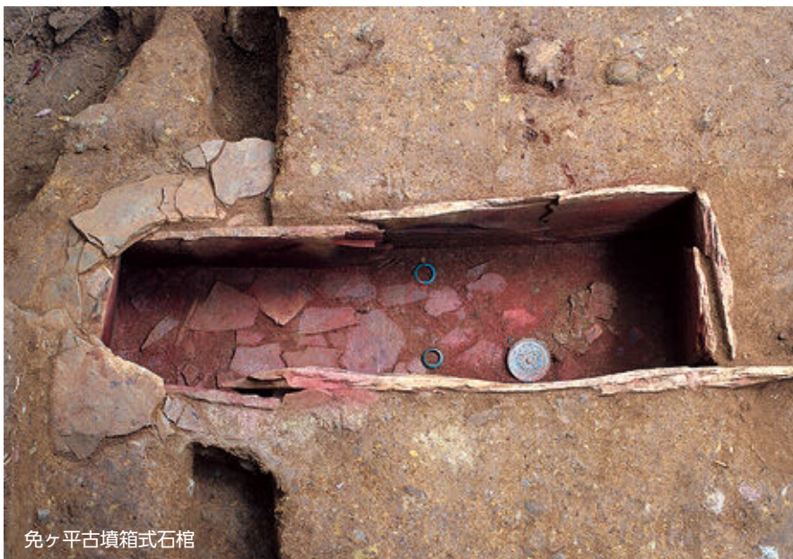
免ヶ平古墳箱式石棺