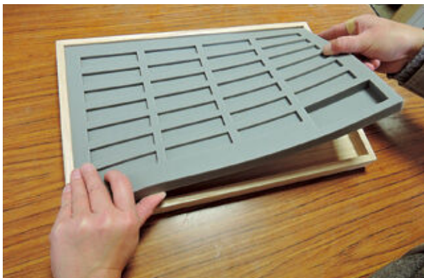
シリコン製安定台座