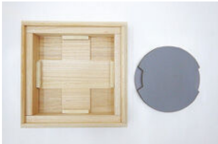
保存箱とシリコン製安定台座