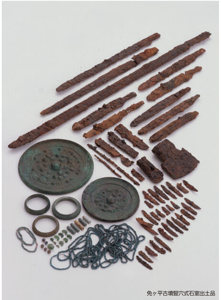
免ヶ平古墳竪穴式石室出土品

これらの免ヶ平古墳出土品は、平成26年に国指定重要文化財に指定され、その価値が広く認められることになりました。