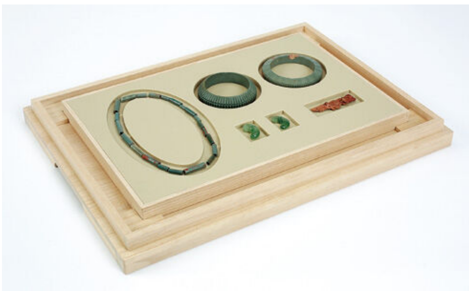
収納状態（舶載斜縁二神二獣鏡を除く）