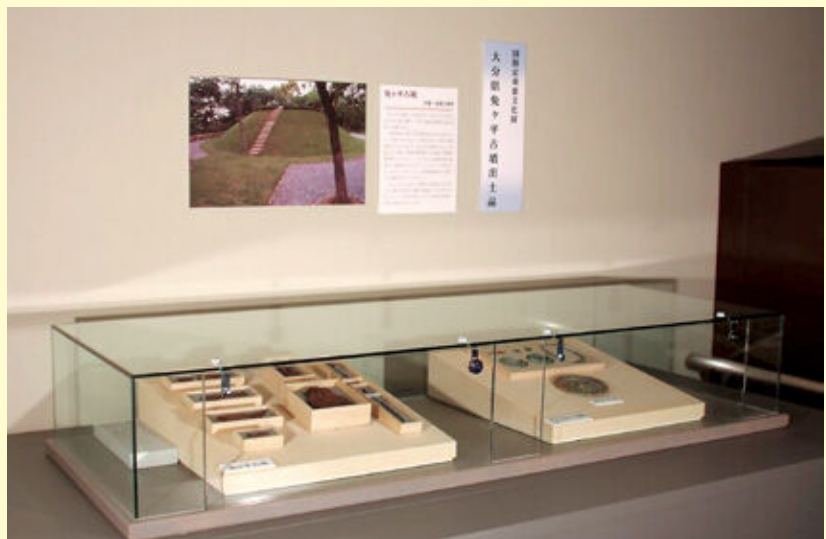
免ヶ平古墳出土品の展示風景

保存修理した重要文化財大分県免ヶ平古墳出土品は、温度と湿度等の管理が行われている収蔵庫に大切に保管されています。そのうちの一部は展示替えを行いながら、平常展の中で公開・活用を行っています。