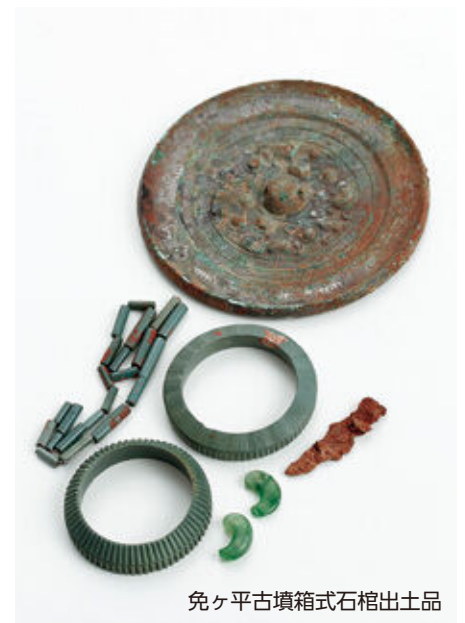
免ヶ平古墳箱式石棺出土品