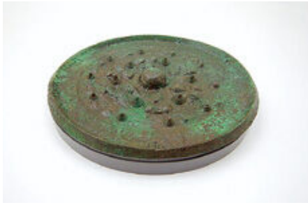
シリコン製安定台座に据えた状態