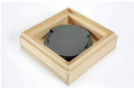
シリコン製安定台座を保存箱に据え付ける