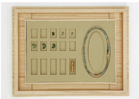
勾玉・管玉の収納状態