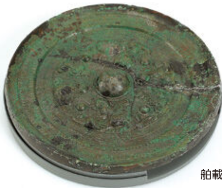
舶載斜縁二神二獣鏡（竪穴式石室出土）