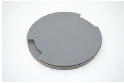
シリコン製安定台座①