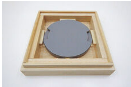
シリコン製安定台座を保存箱に据え付ける