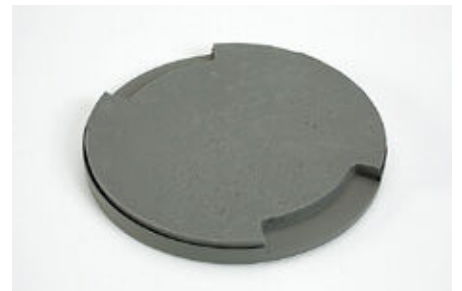
シリコン製安定台座