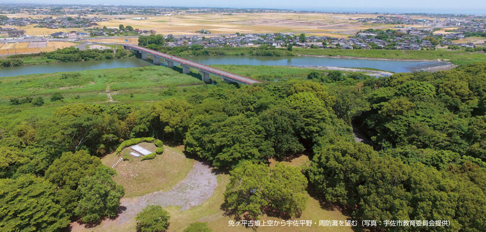
免ヶ平古墳上空から宇佐平野・周防灘を望む

宇佐風土記の丘は、国指定史跡「川部・高森古墳群」を含む約19万㎡を史跡公園として整備したもので、3世紀後半の赤塚古墳から6世紀中頃の鶴見古墳まで、6基の前方後円墳や、これらの古墳の周囲に100基をこえる墳墓が存在します。これらの古墳群は古墳時代を通じ、宇佐の地を支配した首長系譜にある前方後円墳と、それぞれの首長に繋がる一族の墳墓群であると考えられています。中でも、鶴見古墳を除く前方後円墳は駅館川東岸の高台や縁辺に造営されており、宇佐平野を見下ろす位置であるとともに、宇佐平野に住む人々からしてみれば、首長墓として仰ぎ見る絶好の立地環境にあります。