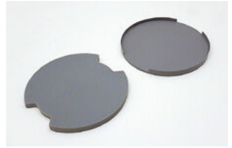
シリコン製安定台座②