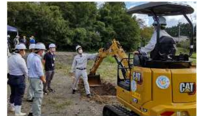
体験会（ICT 建設機械体験会）

本県においても、平成29年度からICT活用工事に取り組んでおり、令和5年度は、擁壁工や基礎工を追加するなど、対象工種を拡大しました。また、ICT建設機械の導入費用の補助事業により建設会社21者を支援したほか、ICTを活用できる人材を育成するため、研修フィールドの整備や体験会を開催するなど、普及拡大に取り組んでいます。