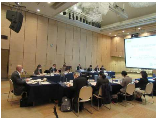
事業評価監視委員会の状況

令和5年度の事業評価監視委員会では、土木建築部、農林水産部あわせて事前評価対象3事業、再評価対象14事業、事後評価対象4事業の計21事業が審議され、各々の対応方針案について「妥当」であるとの審議結果が知事あてに答申されました。