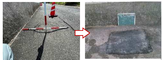
陥没した舗装の補修