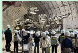
トンネル工事現場見学 (日田市立三和小学校)