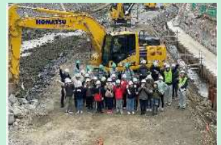
河川工事現場での体験会 (臼杵市立上北小学校)