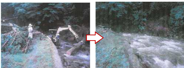
河川内支障流木撤去

土木事務所では、災害発生時などに迅速な対応ができるよう、日頃から防災資機材を備蓄するなど地域防災力の向上に努めます。また、防災や生活環境の保全等を図るため、河川等の倒木・流木等の撤去や施設の修繕等を行います。