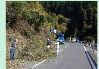
道路支障木伐採 (菅原山浦線)