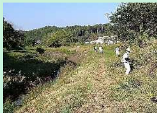
河川清掃活動 (玉田川)