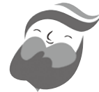
犯罪被害者等支援 シンボルマーク ギョuttoちゃん

県内でも様々な犯罪が発生しており、誰もが被害者となる可能性があります。被害者やそのご家族・ご遺族は、犯罪による直接的な被害を受けた後も、次のような二次的被害に苦しめられています。