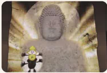
熊野磨崖仏 (エントランス)