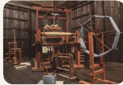
後藤家住宅模型 (信仰とくらし)