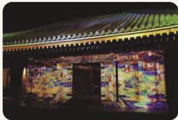
富貴寺大堂 (常設展示室)