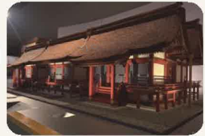
宇佐神宮本殿模型(宇佐八幡の文化)