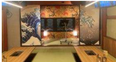
R7認定(焼肉ホルモン黒野)