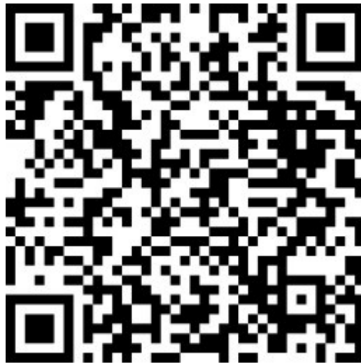
電子申請アドレス二次元コード

電子申請アドレス： https://ttzk.graffer.jp/pref-oita/smart-apply/apply-procedure/4257453327960064762