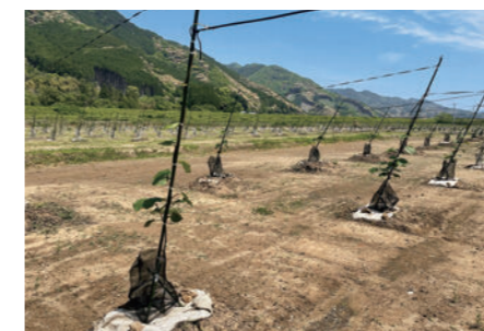
キウイフルーツの大規模造成園地

基盤整備事業を活用し、遊休化した農地の集積を図るとともに、果樹園地の整備を進めています。造成した園地では、参入企業による新植が進み、キウイフルーツの産地が拡大しています。