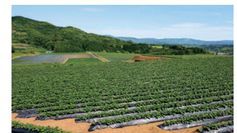
高糖度かんしょほ場

生産者、行政、農業団体が一体となって、農地や新規栽培者の確保等を進め、高糖度かんしょの産地が拡大しています。また、乗用収穫機、定植機等の導入で作業の省力化、効率化を図ることにより、既存生産者の規模拡大を推進しています。