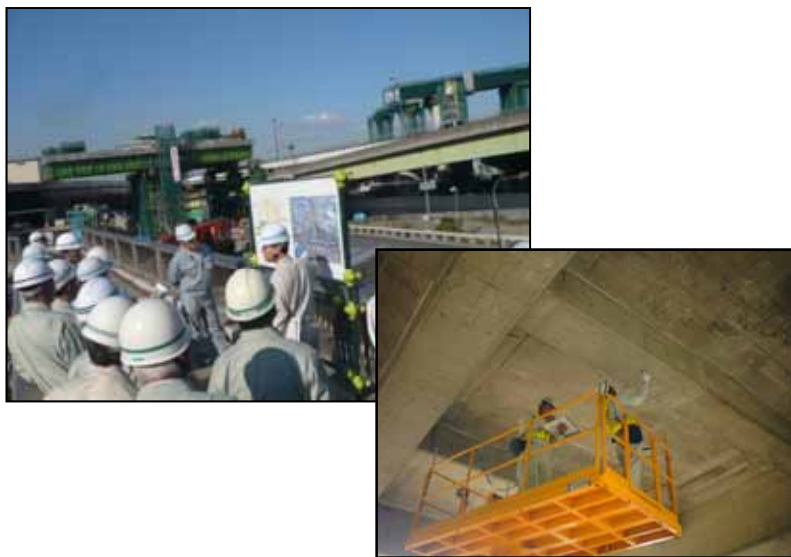
【現場講習会や技術交流】