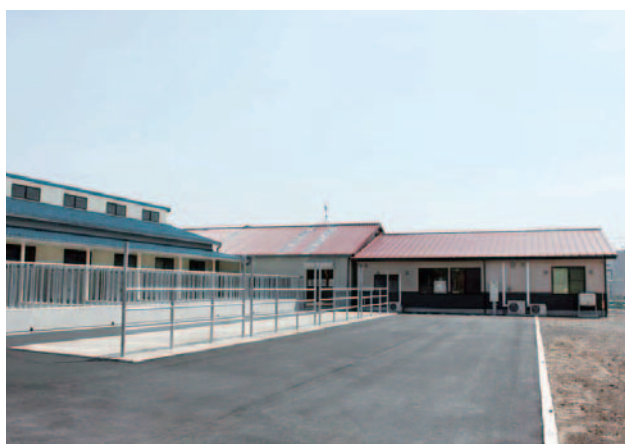
種雄牛舎と繋ぎ場