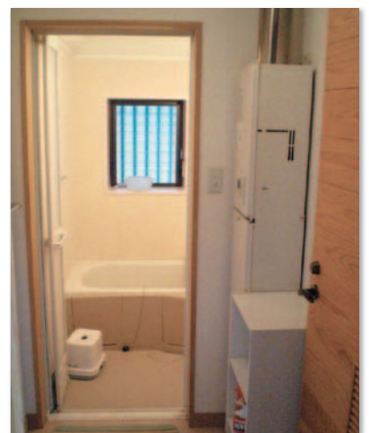
浴室 (シャワー完備)