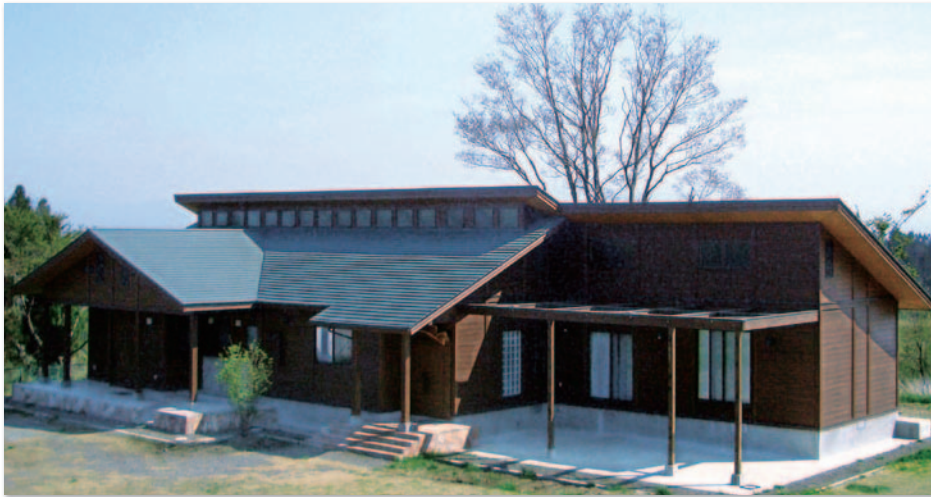
寮全景 (県産材使用)