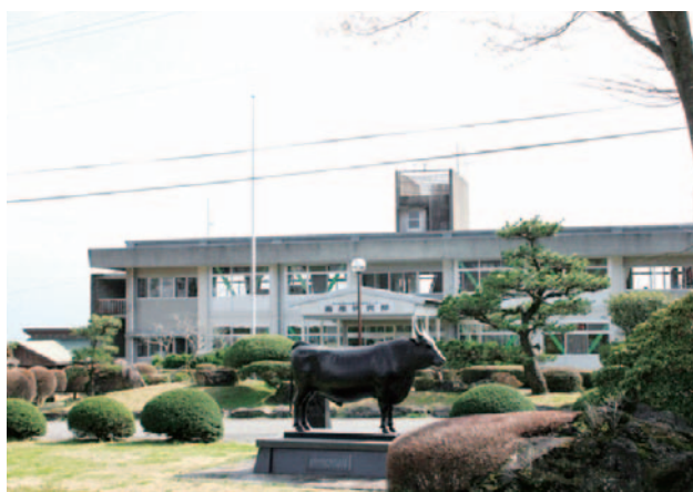
畜産研究部本館と「糸福」号の銅像