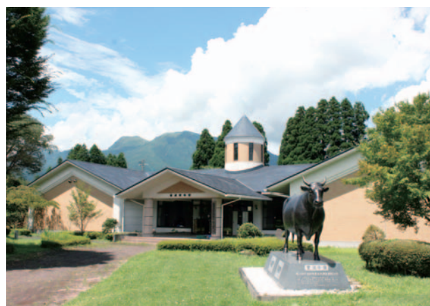
研修館（畜産研究部資料館）