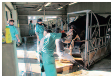
家畜人工授精講習会