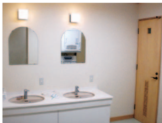
洗面所・お手洗い