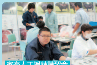
家畜人工授精講習会