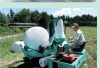
飼料収穫調製実習