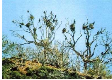
カワウの生息 (佐伯市 沖黒島)

南部の自然海浜にはアカウミガメの上陸・産卵がみられたが、近年では上陸・産卵が減少しつつある。また、アマツバメ、カラスバトやカワウ等の飛来・生息が沿岸各地で観察されている。