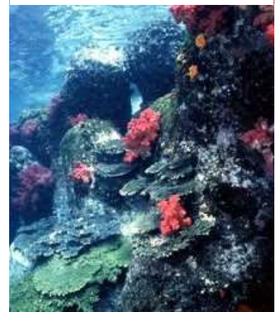
サンゴの群生地 (屋形島・深島海中公園)