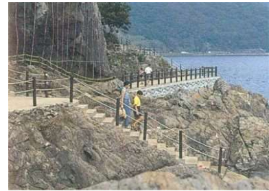
瀬会公園 (シーサイドプロムナード)

航路は、佐伯港からは四国の宿毛港へ、臼杵港からは八幡浜港へフェリー便がそれぞれ就航している。