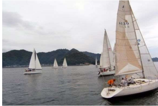
ヨット体験型施設

本沿岸では、佐伯市の船上神楽、蒲江神楽（県指定無形民俗文化財）等、様々な歴史的・文化的な行事が継承されている。