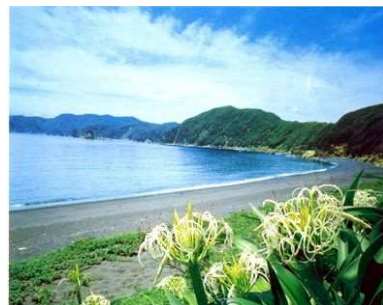
ハマユウの自生(佐伯市)