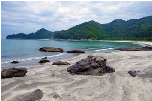
波当津海岸「日本の白砂青松百選」