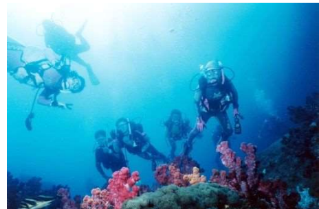
海中散歩 (深島・屋形島海中公園)

海水浴は、佐賀関半島から県境にかけて、黒島、瀬会、元猿等の海水浴場が多数位置し、夏季は活発に利用されている。黒島海水浴場、瀬会海水浴場については、平成 18 年度に環境省から「快水浴場百選」として認定されている。