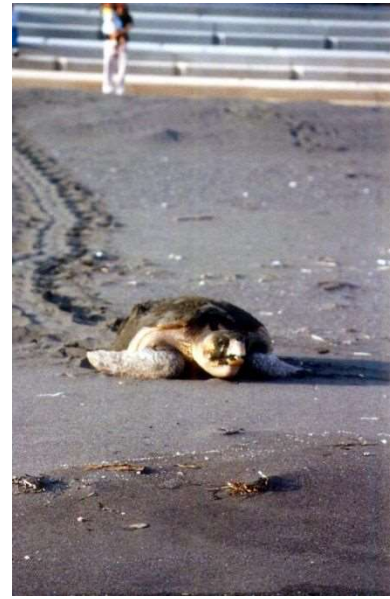
アカウミガメの上陸 (元猿漁港海岸)