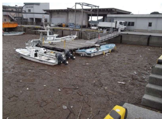
台風後の漂着物（津久見港 H26.10.13）

台風や大雨後の海岸には、大量の漂着物が押し寄せ、生態系を含む海岸の環境の悪化、白砂青松に代表される美しい浜辺の喪失、海岸保全機能の低下、漁業への影響等が生じている。