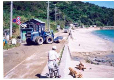
被災状況(佐賀県海岸)

今後、長目漁港海岸や日代漁港海岸など一部の区間では、海岸保全施設の天端高不足や老朽化等により整備の必要な箇所が残されている。また、新たに L1 津波による天端高が不足する箇所の整備が必要となっている。これらの継続的な整備と新たな津波対策整備が重要な課題となっている。