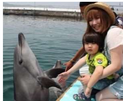
体験型施設「つくみイルカ島」