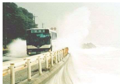
越波状況（佐賀関海岸）

台風が九州を縦断する場合、台風経路の東側の地域で南寄り（南東→南）の風が発生するため、高潮による浸水被害等の危険性が高く、九州南部を通過する場合においても、太平洋から進入する「うねり」による浸水被害等の危険性が高い。