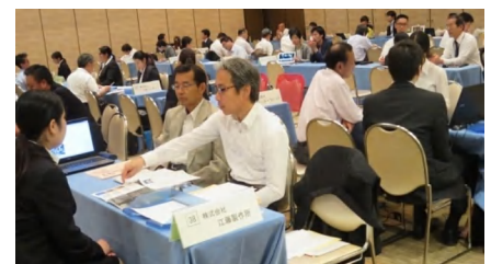
説明会で面談する企業担当者と参加者

8月15日(月)、UIJターン希望者・新規大卒者合同企業面接会が大分市のトキハ会館で開催されました。面接会には県内の企業65社が参加し、県内での就職を考えているUIJターン希望者や新規大学卒業予定者など60名が会場を訪れました。