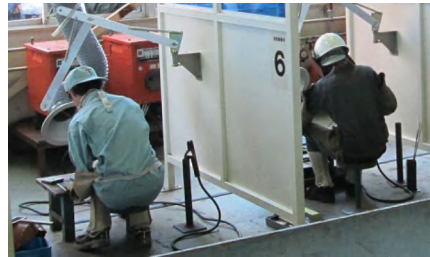
溶接競技会で課題に取り組む高校生

競技会では猛暑の中、制限時間内に課題を仕上げるため、高校生たちは汗だくになりながら溶接作業に取り組みました。