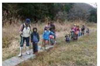
ノルディック・ウォーク