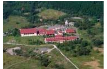
九重青少年の家全景