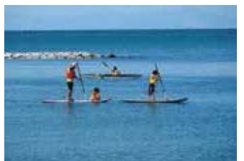
パドルサーフィン

（平成26年度は、ノルディック・ウォーク、海水浴、カヌー体験、パドルサーフィン、野鳥観察、ダンボールハウスキャンプ、ピザづくり、タグラグビー、ネイチャークラフトなどを行いました）