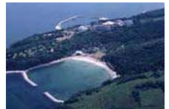
香々地青少年の家全景