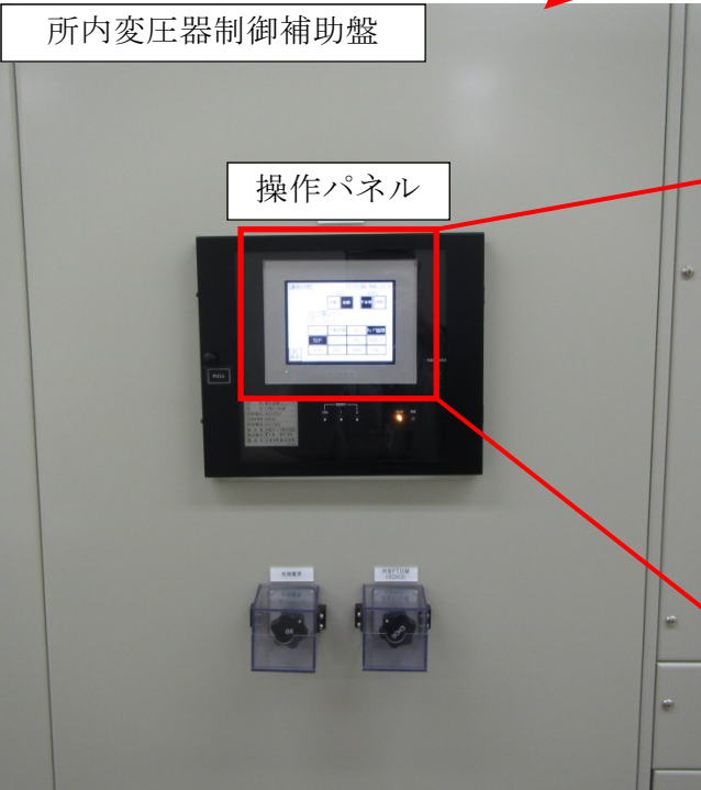
操作パネル表示 (今回事象発生時の状況)