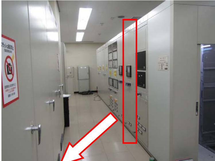
所内変圧器制御補助盤