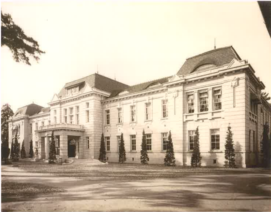
大正十年～昭和三十七年旧県庁舎の写真