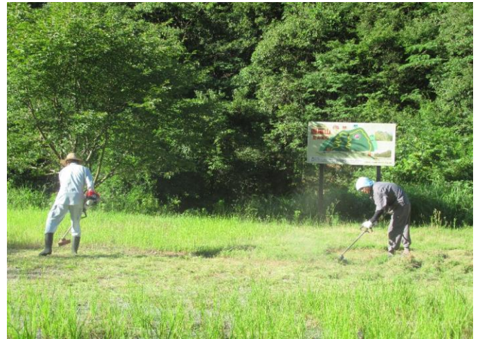
鹿嵐山登山道駐車場、草刈作業中