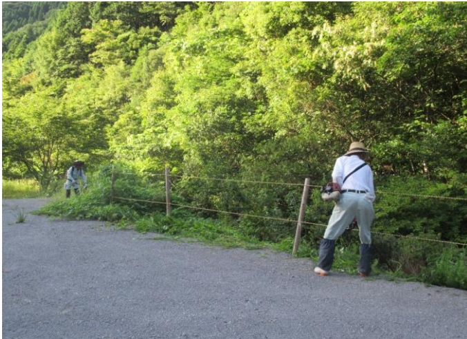
鹿嵐山登山道駐車場、草刈作業中