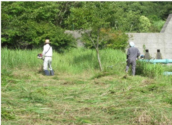
砂防公園内、草刈作業中