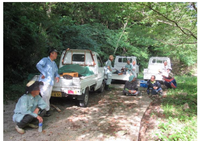
作業合間の休憩に歓談する集落員と応援隊