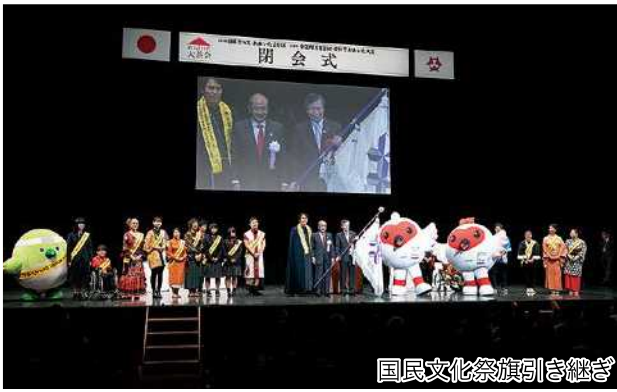
国民文化祭旗引き継ぎ