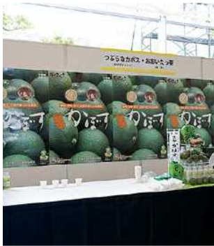
イベント紹介ブース