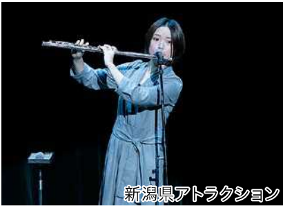
新潟県アトラクション