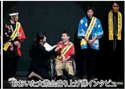
おおいた大茶会盛り上げ隊インタビュー