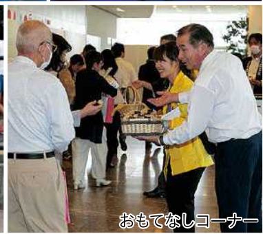
おもてなしコーナー