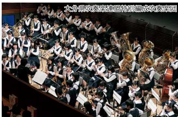
大分県吹奏楽連盟特別編成吹奏楽団