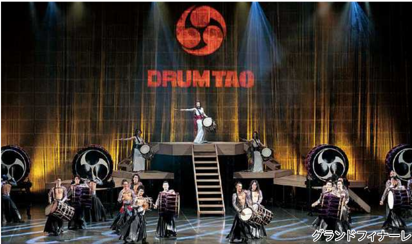
グランドフィナーレ