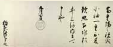
徳川吉宗から白杵藩主宛に出された書状

先哲史料館は、開館して25年が経ち、その間に数万点に及ぶ史料を収集しました。今回は、その中から江戸幕府の將軍や老中からの手紙、村の庄屋が作成した文書や記録類等を精選し、さまざまな近世大分の姿を紹介します。ぜひご来館のうえ、近世大分の歴史や文化に触れてみてください。