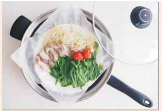
レシピ提供:石動 敬子(大分市)

豚バラ(しゃぶしゃぶ用)50g 冷凍うどん……………1玉 水菜(白菜でも可)……………40g めんつゆ……………適量 もやし……………60g (好きなドレッシングでも可) ミニトマト……………2個