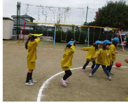
「ボールが来たよ。」「逃げて！」