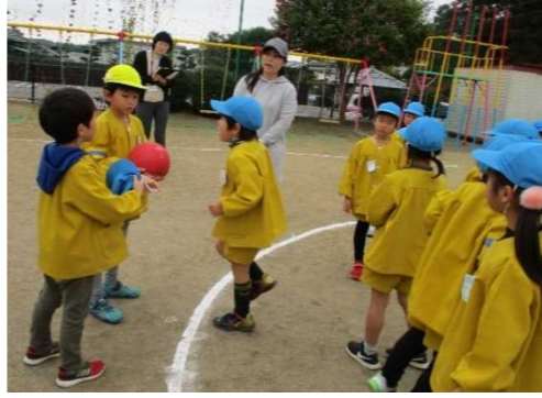
近過ぎた友だちに「セーフ」の判定