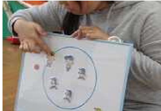
ボードを使って状況説明する保育者