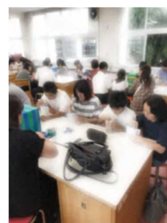
【制作した簡易トイレ】