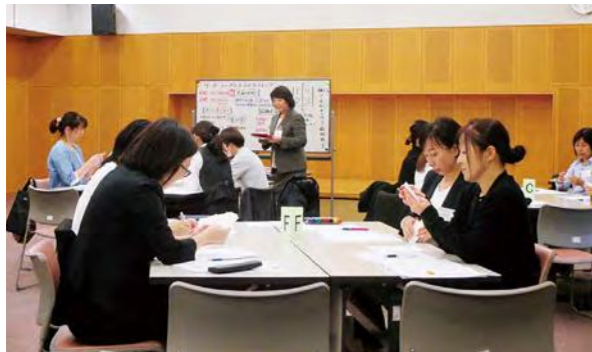
次世代女性リーダー養成セミナー