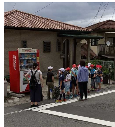
自動販売機を調査(別府市立大平山小)