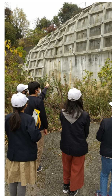
急傾斜地を調査(豊後高田市立桂陽小)