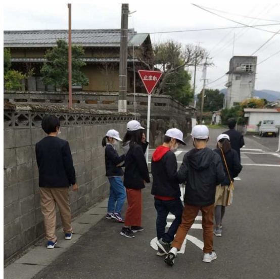
ブロック塀を調査(豊後高田市立桂陽小)