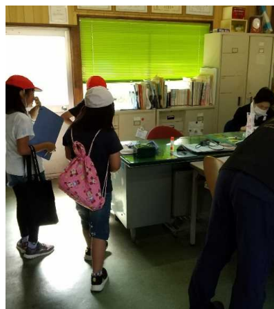
水害体験を聴き取り(竹田市立豊岡小)