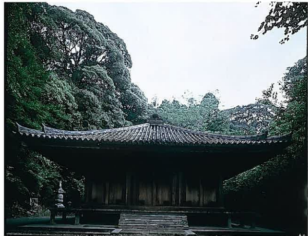
—歴史的資源（富貴寺大堂（国宝））—