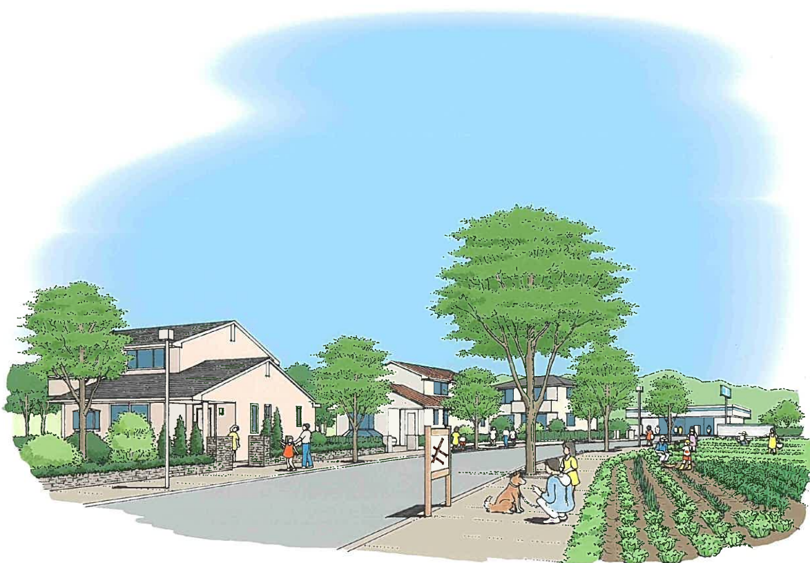
—良好な住宅地の整備イメージ—

本都市計画区域では、用途地域内人口が減少傾向にある一方で、用途地域外の人口が増加している。今後とも、中心市街地の活性化などを促進するとともに、無秩序な市街化が進まないよう立地適正化計画に基づき商業地の周辺に住宅地を配置するとともに、既存ストックの有効活用や老朽化した空き家の除却等により適切な土地利用の誘導を行い、良好な居住環境と定住人口の確保に努める。このうち都市基盤整備の不十分な住宅地については、その改善を図り良好な居住環境の形成に努める。