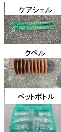
写真1. 天然採苗試験に用いた採苗器

また、採苗時期や適地に関するデータの蓄積により、試験海域における天然採苗は、7～8月に港口部などの波当たりが比較的強い海域の潮間帯上部(岸壁のカキ密生帯から下約10～60cm付近が目安)で行うのが最も効果的であるということが明らかとなった。