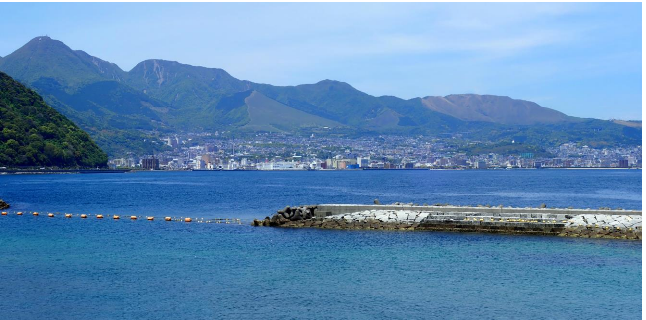
4401307 別府の扇状地地形（別府市）