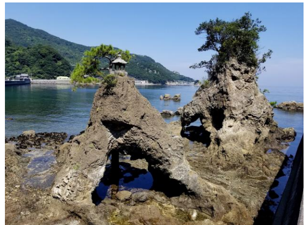
泥岩の海食洞（津久見市深良津）