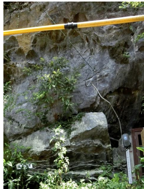
鍾乳洞入口 (上部に落石の跡)