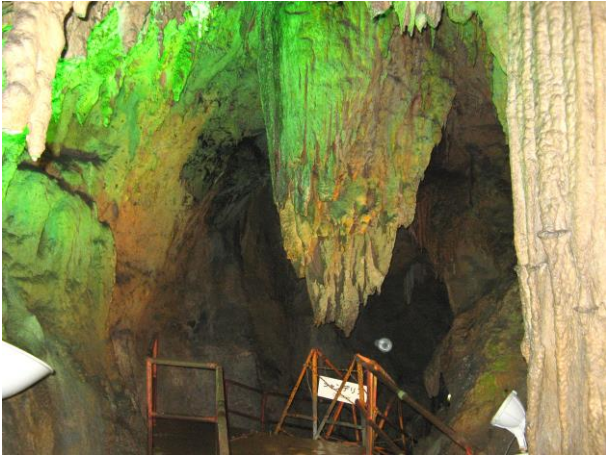
シャンデリア (2007年調査時)