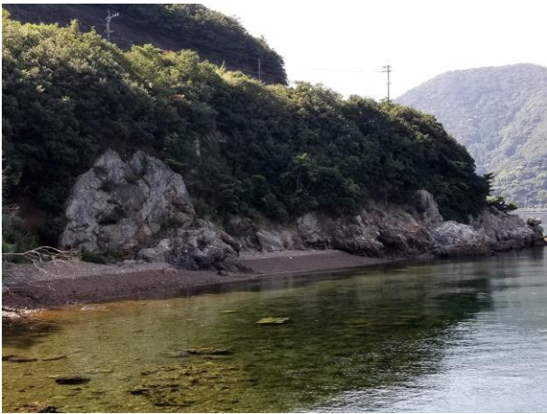
チャート断崖（津久見江ノ浦）