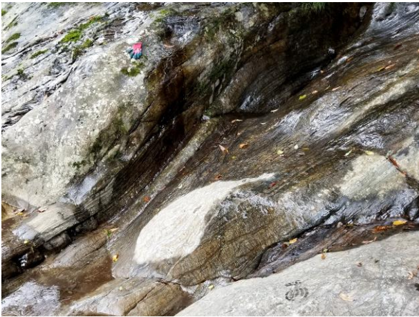
取水・貯水設備上流の椎葉層