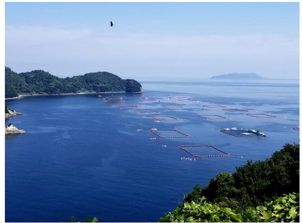
魚養殖場（津久見市赤崎）