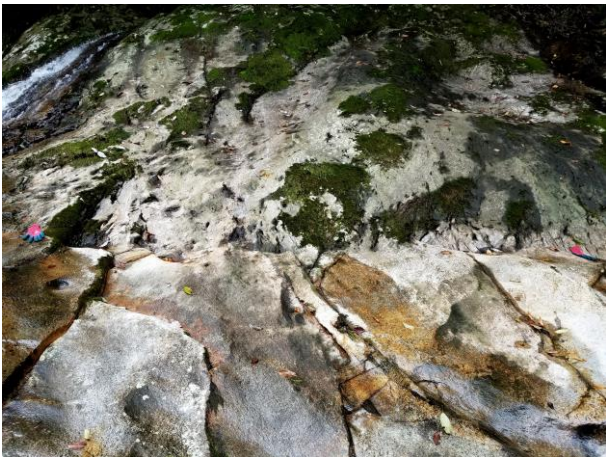
取水・貯水設備上流の椎葉層