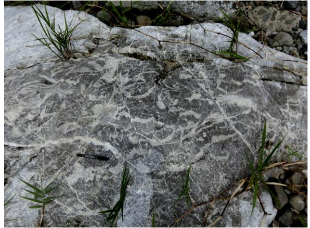
メガドロン化石 (大水車前)