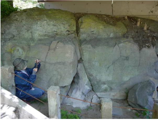
線刻画のある阿蘇 4 火砕流堆積物