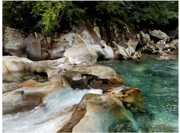
取水・貯水設備対岸の花崗岩