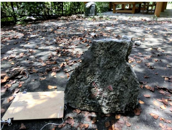
入口付近の落石した岩塊