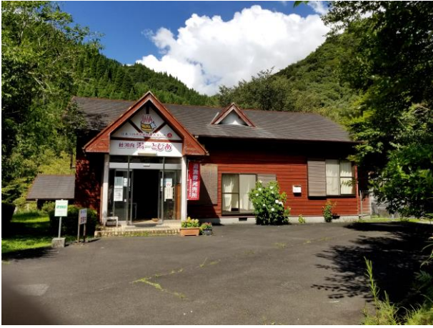
藤河内湯一とぴあ