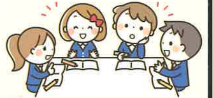
安心して学べる「学びに向かう学習集団」