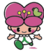
大分県人権啓発 イメージキャラクター こころちゃん