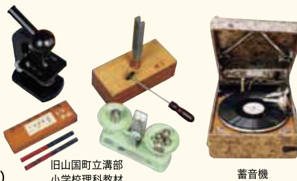
旧山国町立溝部小学校理科教材