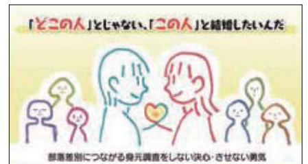
令和3年度「差別をなくす運動月間」身元調査追放ポスター