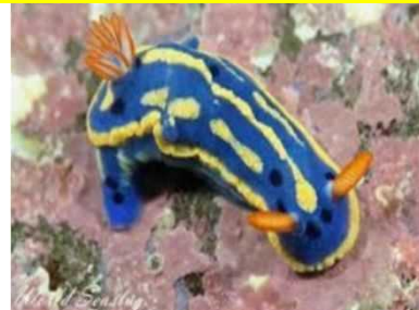
アオイロウミウシ