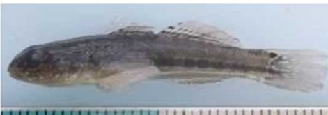
アカオビシマハゼ