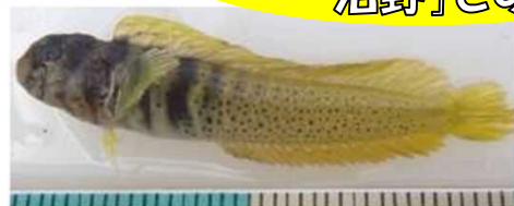
ナベカ(イソギンポ科)