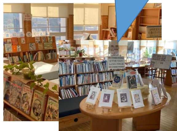
充実した図書館環境