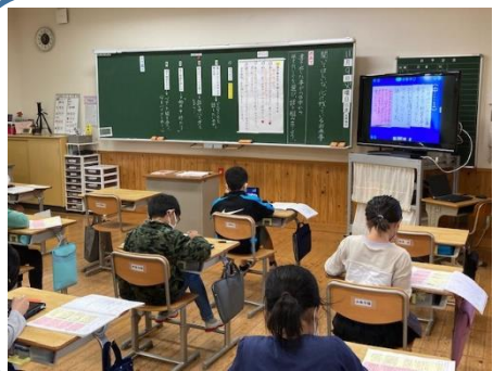
4年 国語科⇒1人1台端末の活用