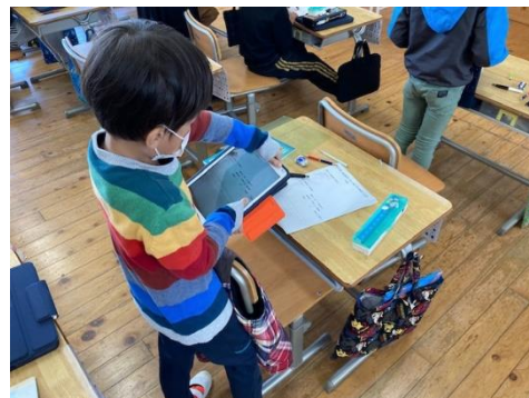
1年 算数科⇒ワークシート撮影