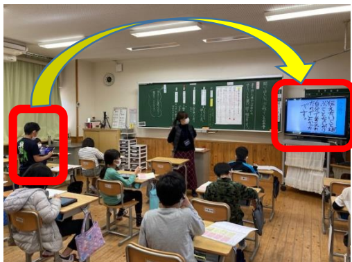
4年 国語科⇒振り返りを共有