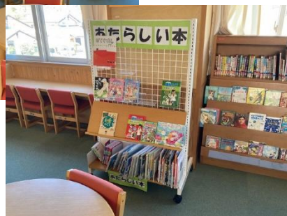
図書館環境の充実