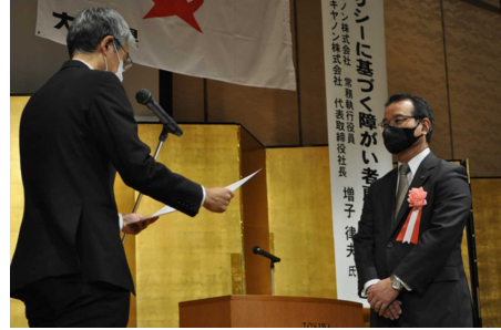
感謝状贈呈式の様子