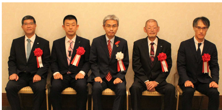
左から 大分キャノンマテリアル株式会社様、有限会社東栄工業所様、 黒田副知事、社会福祉法人庄内厚生館様、ホンダ太陽株式会社様

また、今回の「おおいた働き方改革」トップセミナーでは、企業経営者等を対象に、働き方改革への理解をさらに深めていただくため、株式会社デジタ