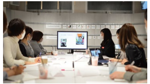
dot.(福岡市中央区大名1-15-35 大名247ビル 2階)