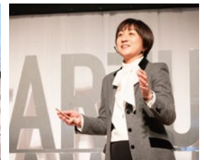
第5回おおいたスタートアップ ウーマンアワード