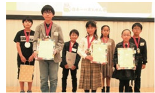
次世代プログラマー発掘コンテスト