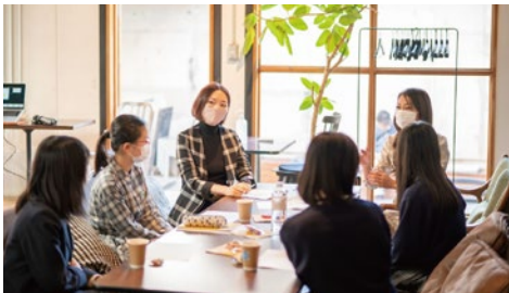
女性起業家による女子学生ワークショップ