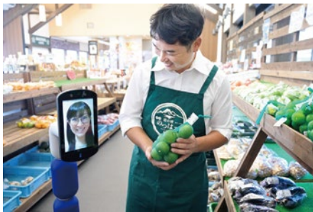
アバターによる買い物体験(道の駅のつはる)