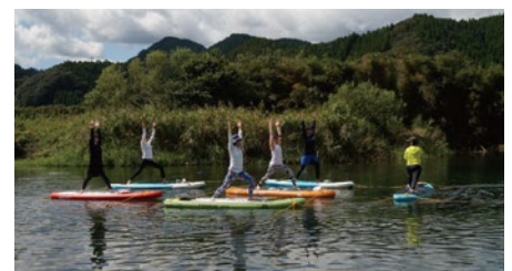
観光サービス(SUPヨガ体験)