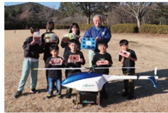
キャンプ素材をドローンで配達(大分農業文化公園)