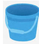
洗ったバケツとペットボトル