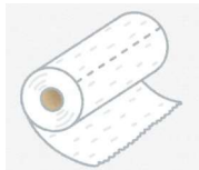
キッチンペーパー