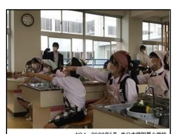
NO.4 2022年5月 大分大学附属小学校