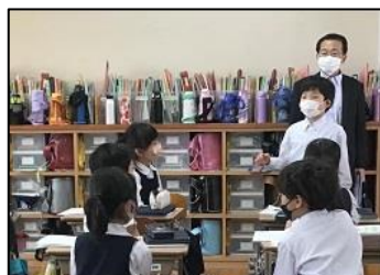
NO.5 2022年5月 大分大学附属小学校