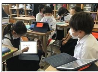
NO.6 2022年5月 大分大学附属小学校