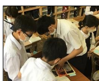
NO.3 2022年5月 大分大学附属小学校