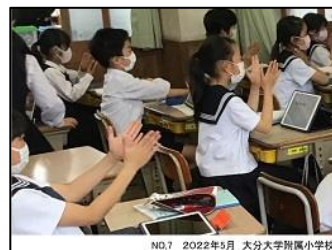
NO.7 2022年5月 大分大学附属小学校