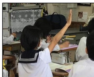
NO.2 2022年5月 大分大学附属小学校