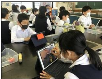
NO.1 2022年5月 大分大学附属小学校

参観した授業では、先生方と子ども達の笑顔がとても印象的でした。先生と子どもとの縦の信頼関係が築かれていると感じました。また、本時でつけるべく資質・能力が明確であり、とりわけ情報活用能力の育成を意識した授業を行っていると感じました。子ども達の姿から、私も元気と勇気を頂きました。