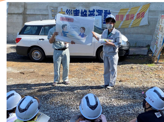
女性職員が土木の仕事について説明！

にありがとうございました。 帰り際に、「こんな仕事をしてみたい。」とつぶやいていた女子がいました。男性中心のイメージが強い職場で、女性が働いている姿を見たためでしょうか。職業選択の幅が広がった機会にもなりました。