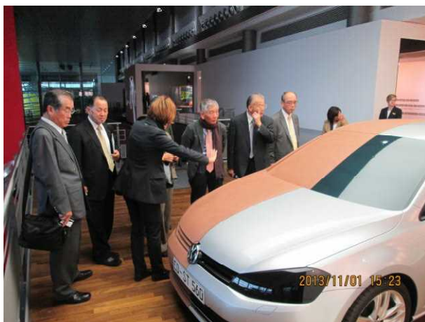
カーデザインスタジオ（車の右半分は粘土）

当地ヴォルフスブルクは既に成熟された街が形成されている中において、未来に向かっての新しい「社会づくり」であり、「新しい産業構造」への取組が集結されていると思われた。「アウトシュタット構想」が浮上した折、その壮大な理念・コンセプトを遂行するために、企業はいうまでもなく、行政と共にいわゆる官民が一体となって新しい社会の構築・都市づくりを目指したことがうかがわれる。一例として土地利用についてであるが、先に述べたように成熟された都市は当然多くの法律や規制の下に出来上がっている経緯がある。