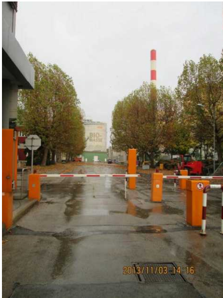
バイオマス発電所の入口

スということである。コンクリートの壁に「B I O M A S S E (バイオマス)」と書かれているのが見えたが、そこに焼却炉と発電機があるとのことである。