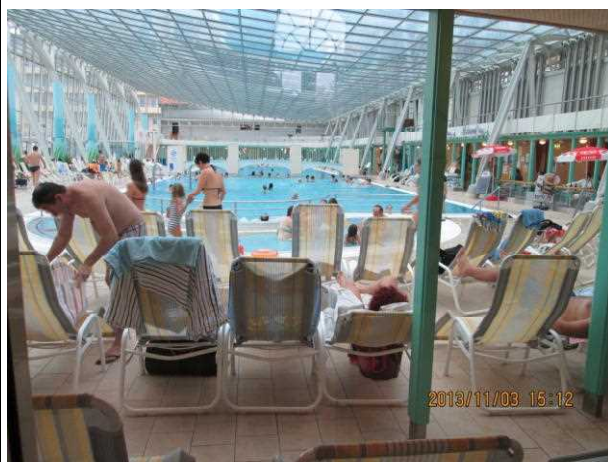
プール（温泉）の様子

まさに、この施設は日本のスポーツクラブやリハビリセンター、エステの複合施設といった印象である。