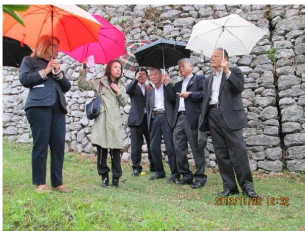
調査した農園も斜面にある。

たりキュールの開発は素晴らしいものである。もう1つは、この地域の海岸線がユネスコの世界遺産に登録されており、海岸、建築物、急峻な農地の石垣、果樹園全ての景観が保持されなければ価値を落としてしまうことから、農業の衰退は許されないとのことである。地域としての取組もさることながら、農業に従事する皆さんが誇りと自信を持って取り組んでいることに感銘を受けた。