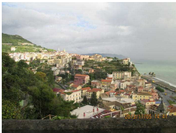
急峻な斜面に囲まれたサレルノ地方

今回の調査先であるレモン農家も、サレルノ湾とその海岸を見下ろすことができる非常に急峻な斜面でレモンを栽培していた。