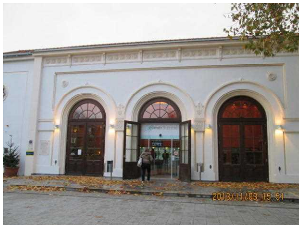
バーデンの温泉施設「レーマーテルメ」

6つのプールがあり、それぞれで温泉の温度は異なるが、28度から36度と日本の温泉と比べるとぬる目になっているが、思ったよりも体の芯から温まる。