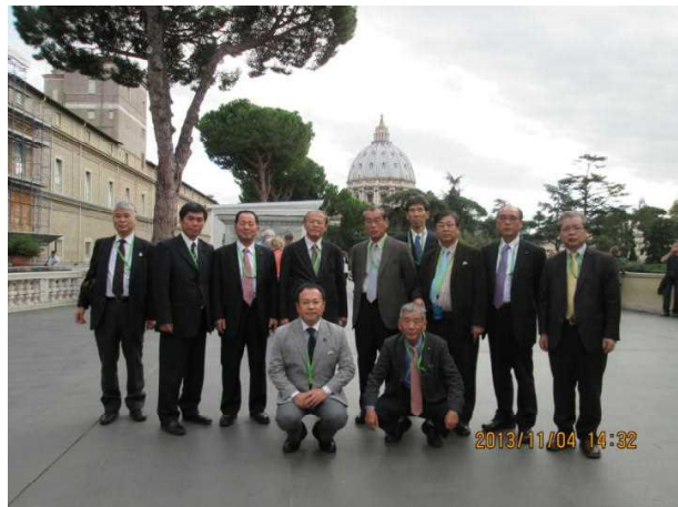
バチカン美術館にて