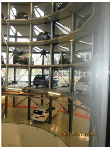
新車が並ぶガラス張りのタワー

自動車博物館「Zeit Haus（時代の博物館）」では、フォルクスワーゲン、ブガッティ、シトロエンなど、様々な歴史的な車種が展示されている。世界初のガソリン自動車であるベンツ（オリジナル）など、車がどのように発展してきたかわかるように展示している。自動車博物館の中では世界で一番来場者数が多いとのことである。