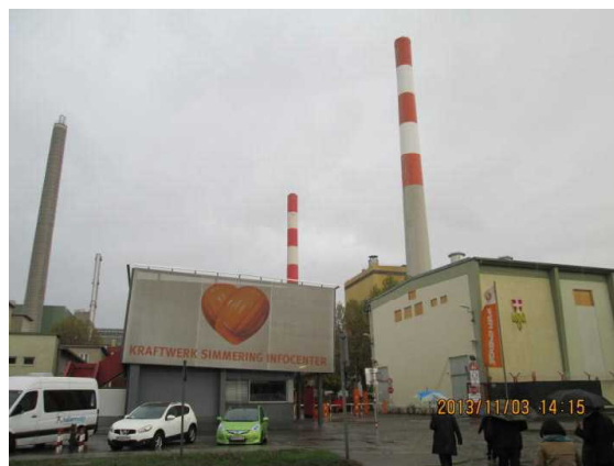
シマリングバイオマス発電所

140メートルの煙突があり、その下の方にバイオマス発電機がある。稼働中の発電機4機のうち、3機は天然ガスと重油、1機がバイオマ