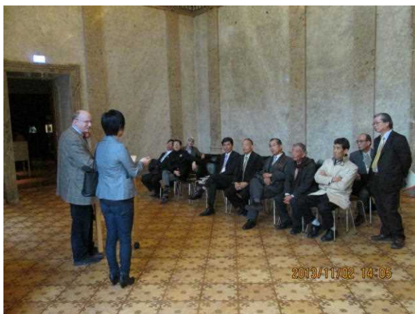
オーストリア演劇博物館にて

県立美術館では、西洋の美術館のように時の権力者の権勢を見せしめるような作品は持ち合わせていないしまたできないことから、竹田の豊後南画などをはじめ、日本的でもありグローバルでもあるような作品を大分の文化・風土をもとに創出する必要があると思われる。