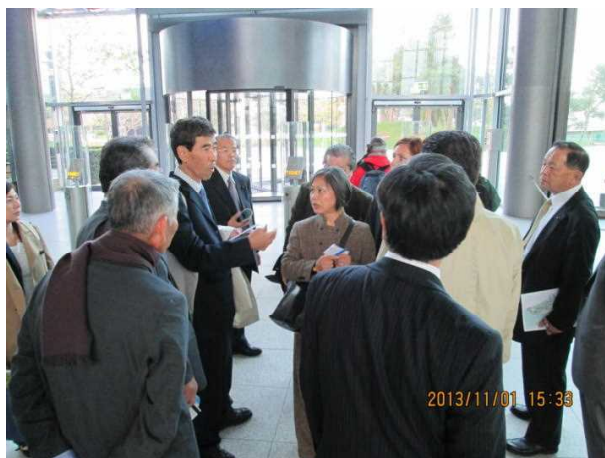
館内で説明を受けながら調査

アウトシュタットの多様性の中に、世界の企業フォルクスワーゲンの広範な目標、そして社会に対する企業としての責任が反映されている。