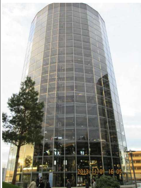
客が受け取りに来る新車を 保管するタワー