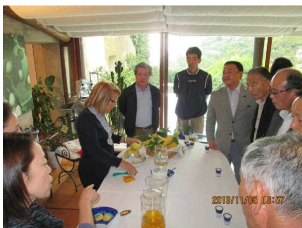
農家レストランでリキュール作りの実演

レモンチェッコは当地の伝統的なリキュールであり、約95%（この農家では93%）のアルコール（醸造するのではなく、よそから仕入れたもの）にレモンの黄色い皮の部分を入れて3日間漬け、レモンのエキスがアルコールに移ったら取り出して砂糖シロップを加えて作っている。この加工に