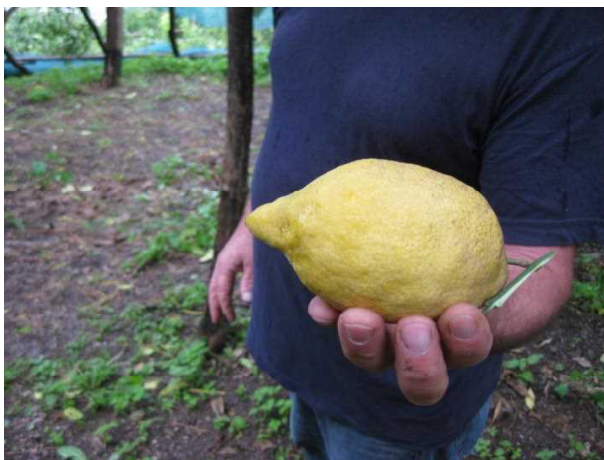
アマルフィのレモン「スフザート」

このように特色を有するレモンであるため、地域の特産品についてのEUの品質保証制度であるIGE イージープイ P（地理的表示保護。なお英語圏ではPGIとなる。）の認定を受けている。IGE イージープイ Pでは定められた地域、生産方法、品質の条件を満たした産品に品質保証をするようになっており、アマルフィ地域のレモンのブランド価値を高めることに貢献していると思われる。