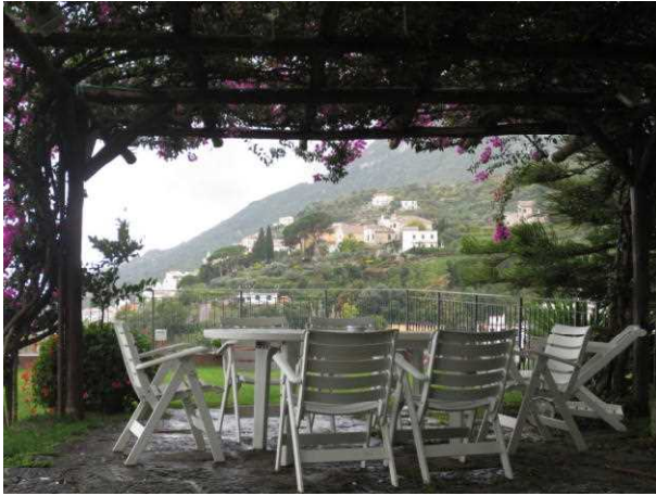
農家で景色を見てくつろぐことができる。

期間滞在するという点で、本県のグリーンツーリズムとは少しイメージが異なるように感じた。