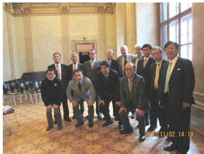
<ウィーン演劇博物館にて>