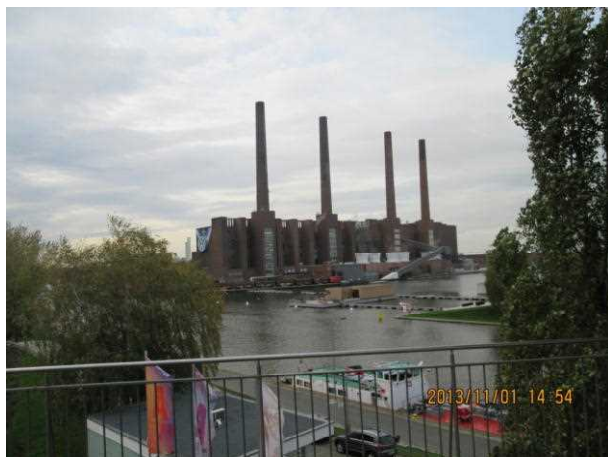
フォルクスワーゲン社工場

アウトシュタットのあるヴォルフスブルクはフォルクスワーゲン社が1938年に工場を構えたことから発展したドイツ北部の都市である。ベルリンから高速列車ICEを使い、所要時間は通常は約1時間であるが、昨年（2012年）の水害により不通区間となっている箇所があり、迂回したため約2時間の移動となった。