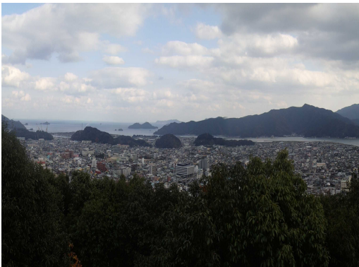
頂上から見える市街地