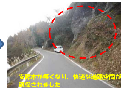
支障木が無くなり、快適な道路空間が確保されました