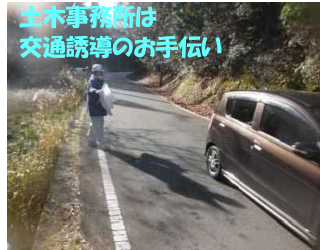
土木事務所は交通誘導のお手伝い！

【作業前ミーティング】朝早くからチェンソー持参で集合。高齢の方が多いですが皆さん現役で準備万端です。