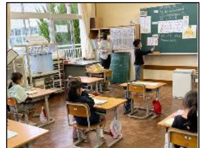
NO.250 2022年10月 由布市立石城小学校