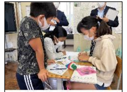
NO.253 2022年10月 由布市立石城小学校