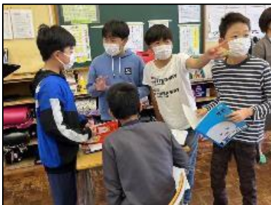
NO.254 2022年10月 由布市立石城小学校

それぞれの考えを出し合い、 確認をする。良さを認め合う ことで、いい方法が見つかる。