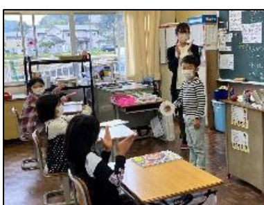
NO.251 2022年10月 由布市立石城小学校