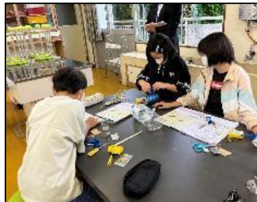
NO.252 2022年10月 由布市立石城小学校