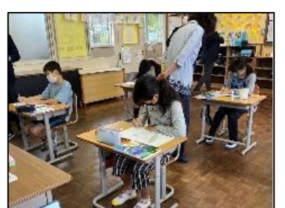
NO.255 2022年10月 由布市立石城小学校

拍手はされた人だけでなく、 拍手をした人も笑顔になる。 拍手のある学級はあたたかい。